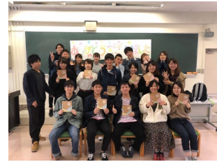
「子どもの学び支援プロジェクト」実習の最終日の写真。後輩たちからのプレゼントや同級生の言葉に涙しました。実習を振り返ると辛いこともありましたが、最高の思い出を築くことができました。

また、実習やゼミのメンバーとは、学生時代から卒業後の今も、共に食事や旅行に出かけるなど、深い友情を育みました。大学生なので贅沢はできませんでしたが、いかに楽しく充実した時間を過ごせるかを皆で工夫した経験は、今もかけがえのない財産です。共に笑い、共に成長した仲間たちとの絆は、社会人となった今も変わることなく、私の人生を豊かにしてくれています。