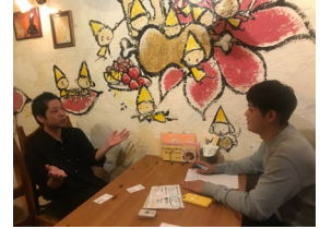
小倉実習 Kokulikeの活動で小倉にあるカフェを取材させていただきました。

その他では友達と色々な場所に旅行に行っていました。務めている会社の社長もよくおっしゃっているのですが、地域ごとに特色があり自分の目で見ること、体験することが学び・経験に直結すると思います。学生時代はそのような視点で見ることは難しかったのですが、思い返すと色々な場所に行って色々な体験をしておいて良かったと感じます。