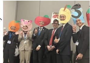
会社では年に1回、全国の社員が集まる決起集会をしており、決起集会にてそれぞれ担当自治体の特産品を被った写真です。

また、greenbirdの活動も卒業後続けており、会社で赴任した岡山、熊本で活動を続け、2025年4月に地元の山口県下関市に新たにgreenbirdのチームを立ち上げリーダーをしています。