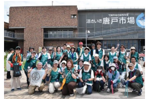
greenbird下関チームの唐戸でのゴミ拾いの写真です。