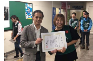
同じ小倉実習にてgreenbirdに所属し、毎週小倉をゴミ拾いしていました。北九州モノレールさんと3カ月に1度コラボごみ拾いを行い、継続的な活動への表彰をいただいた時の写真です。