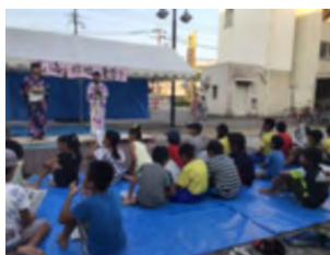
団地での夏祭りイベントは皆で浴衣を着て運営！