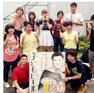
子ども実習で、活動費を増やすために小倉祇園祭りや学園祭にも出展しました！

4年生になると、大学生活の思い出を増やすべく友人との旅行も増えましたが、一人旅でエジプトにも行くなども経験し価値観も広がりました。