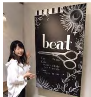
丁度「インスタ映え」の時代で、大きな絵を描きに色々伺いました！

私自身、キャリア形成についてもっと早く向き合いたかったという気持ちがありますし、今後も大学生だけでなく未来を担っていく若者が将来を考えるきっかけを作っていける存在でありたいと思っています。今の仕事は、とても好きでやりがいをもって働いています。年々後輩も増えており、自分だけでなく私に関わる全ての方が楽しくやりがいをもって同じ思いで働けるような動きをしていきたいと思っています。